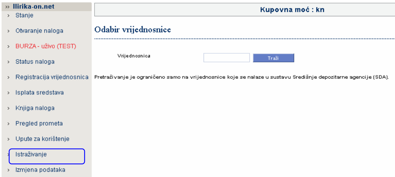
Slika 12. Istraživanje

Upisom naziva, tickera ili samo početnih slova ovaj preglednik nudi pregled nekih važnijih podataka o vrijednosnici.